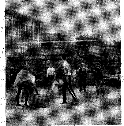
十月七日、試験終了後、私立大塚高校を訪問。この学校は、昭和二十六年四月に福岡大学附属高校として創立され、現在では生徒約二千にもかわらず、校内はきっちりと完成したばかりである。新しい設備に整った学校生活を送っている。その一例として、運動クラブ活動が盛んなことがよくわかる。