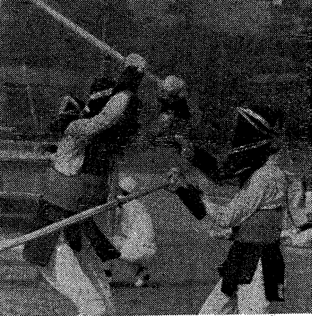
唯一の個人戦剣道の熱戦

読書の窓 若い人 石坂洋次郎 (筑摩書房) 生徒、江波恵子は、料理を営む母の私生活である。教師真崎慎太郎は美貌と無軌道な行動から、強い印象を与えた。しだいに恵子は真崎に愛情を示すようになった。真崎も、いつしか恵子に愛情を持つようになる。修学旅行や、たびたびの自宅の訪問を重ねるうちに、お互いに結婚を誓うようになった。