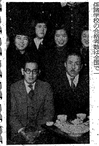
若き日の中村先生と教え子達

くには鹿児島です。尚武のお国柄で私も健児の舎に小学生の頃から入り、二七(青年)たちに鍛えられました。