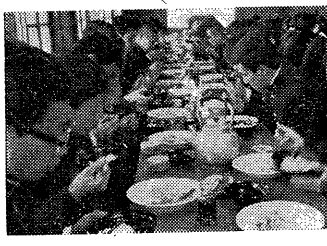
たのしく食台を囲んで