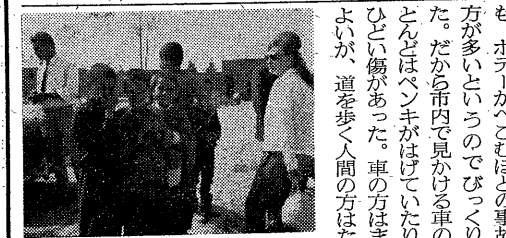
ポーズをとるイランの子供