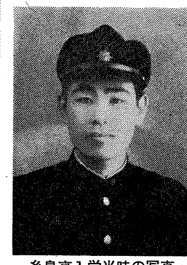
糸島高入学当時の写真